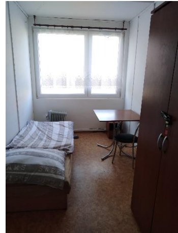
Pokoj na noclehárně

Klienti jsou ubytováni v jednolůžkových a vícelůžkových pokojích.