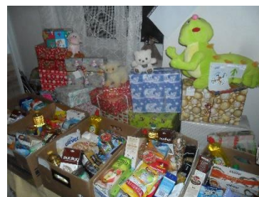
Dárky a potravinové balíčky pro rodiče s dětmi

Azylové centrum zajistilo po dobu velkých mrazů pro bezdomovce, kteří žijí na ulici bezplatný pobyt v Azylovém centru včetně nouzového přespání. Vytvořili se jim podmínky k osobní hygieně, dostanou teplou polévku, kávu, čaj a konzervovou stravu. Navíc momentálně (při spolupráci s potravinovou bankou) i tzv. balíček první pomoci, ve kterém je vše potřebné. Je to pro všechny nově příchozí klienty. Na štědrý den všichni dostali štědrovečerní večeři (kuřecí řízek s bramborem), maminky s dětmi dostali i jiné dárečky z jiných projektů, nebo od jiných dárců, zejména je potřeba zmínit Strom splněných přání pod záštitou Ing. Milady Sokolové.